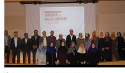
İlahiyat Fakültesi'nde Tanışma ve Bilgilendirme Toplantısı