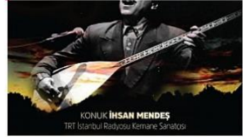
Neşet Ertaş Anma Konseri