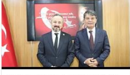
BAŞKAN KAZAN YARGIYA VEDA ETTİ