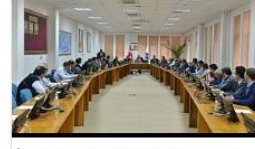
İşletme Fakültesi Danışma Kurulu Toplantısı Yapıldı